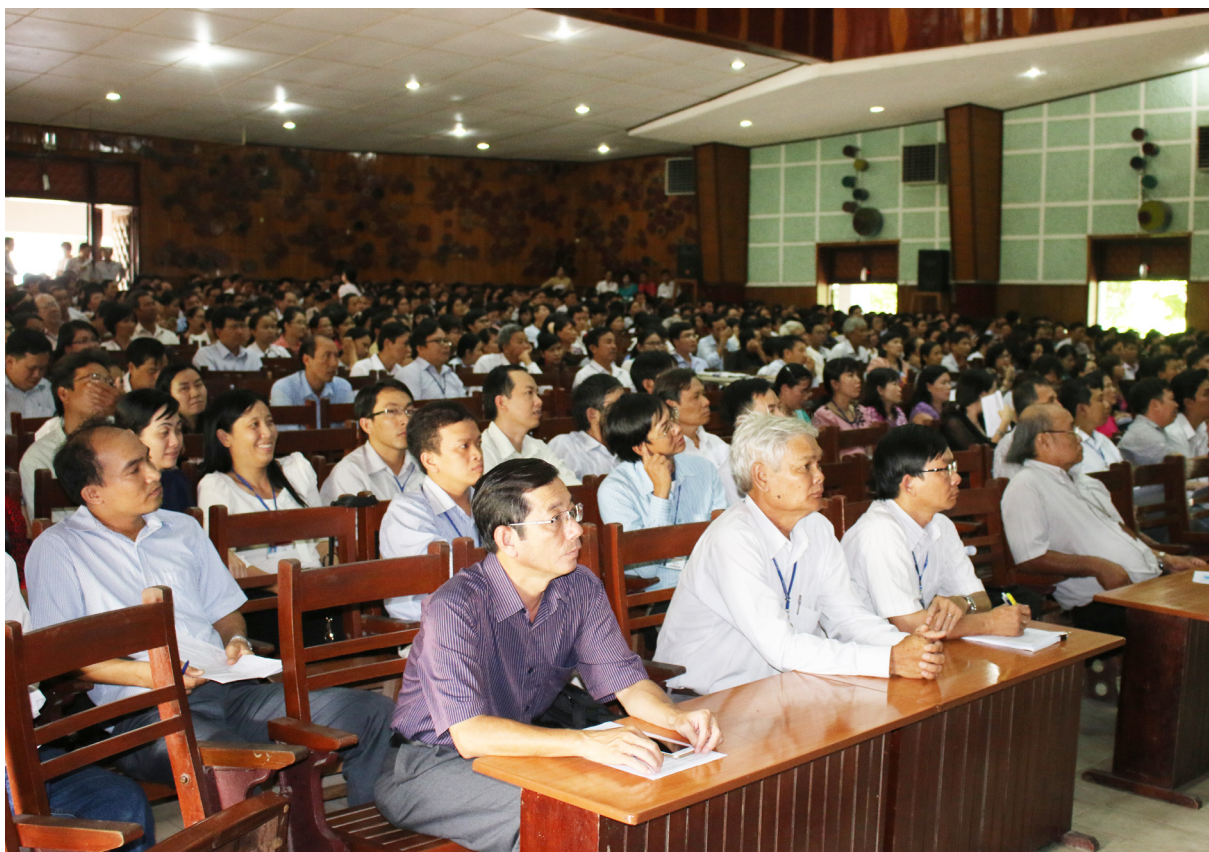
Cán bộ, viên chức và sinh viên dự buổi hướng dẫn nghiệp vụ coi thi kỳ thi THPT quốc gia năm 2015.

sát Phòng cháy chữa cháy của thành phố Cần Thơ. Trong ngày 19/6/2015, Trường tổ chức họp Hội đồng thi, Trưởng điểm thi, Thư ký điểm thi, Giám sát và Phòng ban chức năng để phục vụ cho kỳ thi và tổ chức hướng dẫn nghiệp vụ coi thi kỳ thi THPT quốc gia năm 2015 cho toàn thể cán bộ viên chức và sinh viên tham gia thực hiện công tác coi thi.