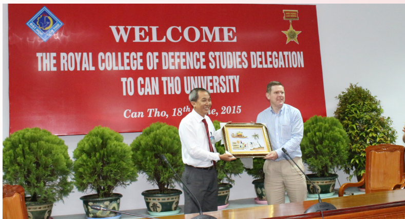
Trao quà lưu niệm tại buổi đón tiếp.

của đất nước Việt Nam trong bối cảnh biến đổi khí hậu, đô thị hóa và sức ép từ việc di dân tới thành phố trong chuyến tham quan, học tập của trường ở ĐBSCL. Trong đó, hai vấn đề nổi bật hiện nay là biến đổi khí hậu và quản lý nguồn nước ở ĐBSCL nhận được sự quan tâm đặc biệt của đoàn.