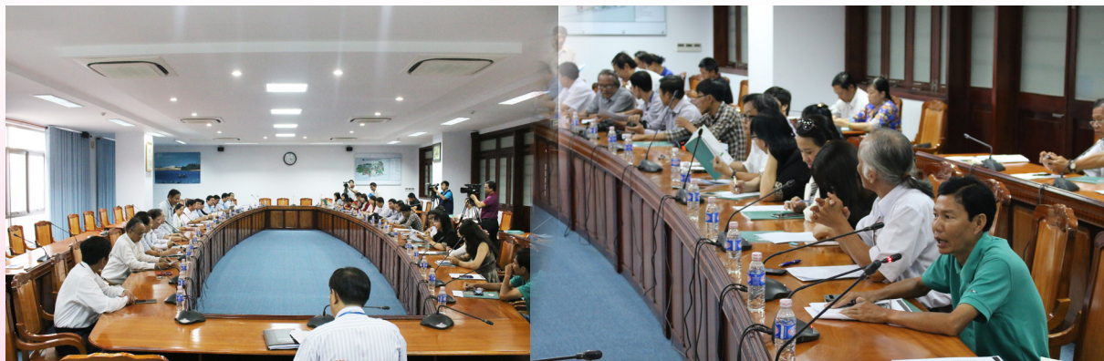
Đại diện lãnh đạo, phóng viên và nhà báo nhiệt tình chia sẻ, đóng góp ý kiến trong buổi họp mặt.

báo, đài, các phóng viên và biên tập viên đã thể hiện sự quan tâm đến công tác đào tạo của Trường và đã có những ý kiến đóng góp, trao đổi thẳng thắn về các vấn đề mà báo giới quan tâm. Các câu hỏi của các phóng viên, nhà báo đã được lãnh đạo nhà trường giải đáp một cách chi tiết và thỏa đáng. Qua đó, lãnh đạo các cơ quan báo, đài, phóng viên, biên tập viên gửi lời cảm ơn đến Nhà trường đã tạo điều kiện tốt cho các cơ quan báo chí tác nghiệp trong quá trình thu thập, đưa tin liên quan đến Trường ĐHCT.