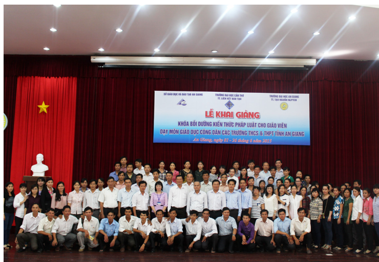
Lãnh đạo các đơn vị chụp hình lưu niệm cùng học viên