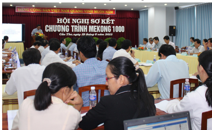
Toàn cảnh Hội nghị Sơ kết Chương trình Mekong 1000.

Theo kế hoạch của Chương trình thì tổng số Tiến sĩ, Thạc sĩ đào tạo ở nước ngoài của 12 tỉnh, thành là 1.015 người (trong đó đào tạo 825 Thạc sĩ và 190 Tiến sĩ). Tuy nhiên, đến thời điểm này, tổng số ứng viên được cử đi chỉ đạt hơn 50% chỉ tiêu được đề ra do nhiều nguyên nhân khác nhau như: công tác quảng bá ở một số địa phương chưa rộng rãi, trình độ chuyên môn và năng lực ngoại ngữ của ứng viên còn hạn chế... Vì vậy, Hội nghị Sơ kết Chương trình Mekong 1000 là dịp để mọi người cùng nhìn lại chặng đường 10 năm qua, chia sẻ những khó khăn thách thức trong thực tiễn hoạt động, đồng thời cùng nhau thảo luận để xây dựng kế hoạch đào tạo nguồn nhân lực phục vụ nhu cầu phát triển của địa phương và vùng ĐBSCL.