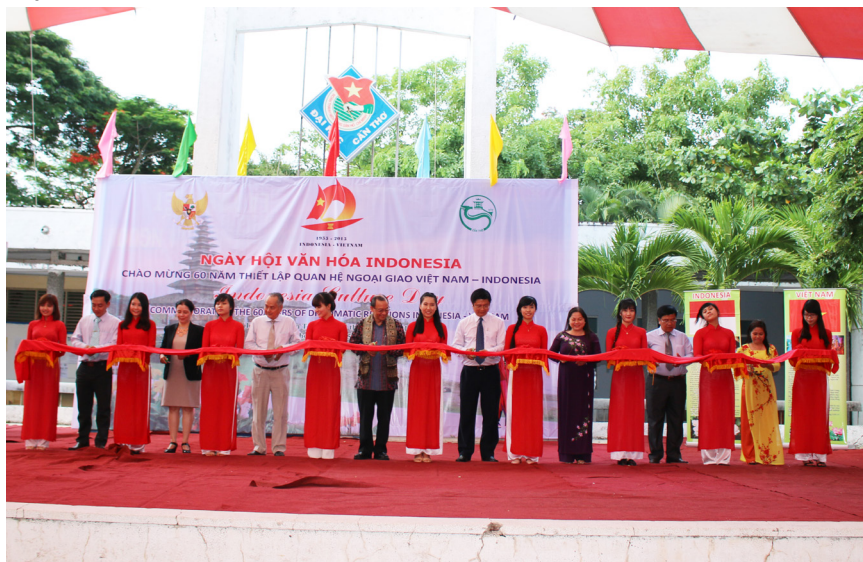
Đại biểu cắt băng khai mạc chương trình.

Ngày 05/6/2015, tại Trường Đại học Cần Thơ (ĐHCT), Liên hiệp các tổ chức hữu nghị thành phố Cần Thơ phối hợp với Tổng lãnh sự quán Indonesia, Trường ĐHTC và Thành đoàn Cần Thơ tổ chức Ngày hội Văn hóa Indonesia nhằm chào mừng 60 năm thiết lập quan hệ ngoại giao giữa Việt Nam và Indonesia.