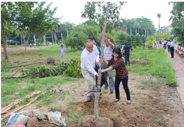
Mọi người nhiệt tình hưởng ứng ngày Môi trường Thế giới 05/6/2015.

Với sự nhiệt tình của tất cả các thành viên tham gia, chỉ trong vòng buổi sáng công việc trồng cây đã hoàn tất, mang lại một quang cảnh đẹp và hoàn toàn mới cho khuôn viên Trung tâm Học liệu và Nhà Điều hành.