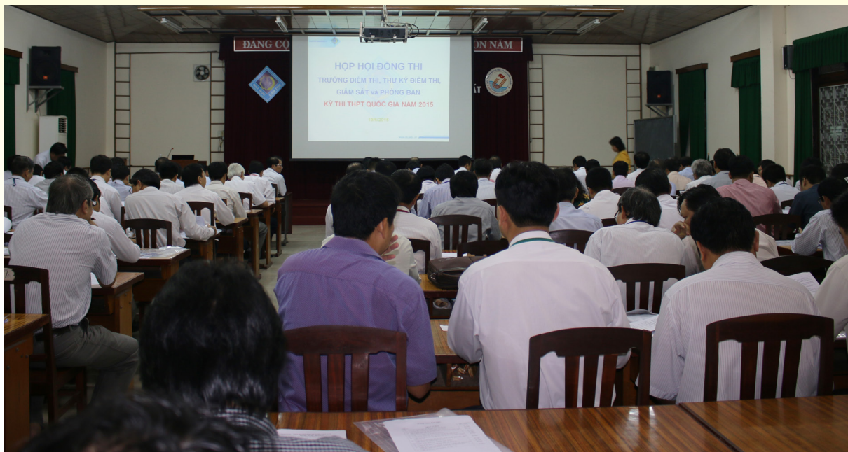
Trường ĐHCT họp Hội đồng thi, Trường điểm thi, Thủ ký điểm thi, Giám sát và phòng ban chức năng phục vụ cho kỳ thi THPT quốc gia năm 2015.

Năm 2015 là năm đánh dấu thực hiện cải cách thi tốt nghiệp THPT và tuyển sinh đại học, cao đẳng (ĐH, CĐ) của Bộ Giáo dục và Đào tạo (GD & ĐT). Theo đó, thí sinh sẽ chỉ tham gia một kỳ thi quốc gia gọi là kỳ thi THPT quốc gia. Kết quả thi được dùng để xét công nhận tốt nghiệp THPT và làm căn cứ xét tuyển sinh vào các trường ĐH, CĐ.