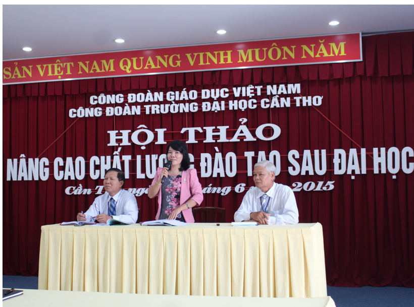
Chủ tọa của Hội Thảo.

giảng dạy sau đại học ngày càng hoàn thiện, nâng cao uy tín và thương hiệu của Trường ĐHCT.