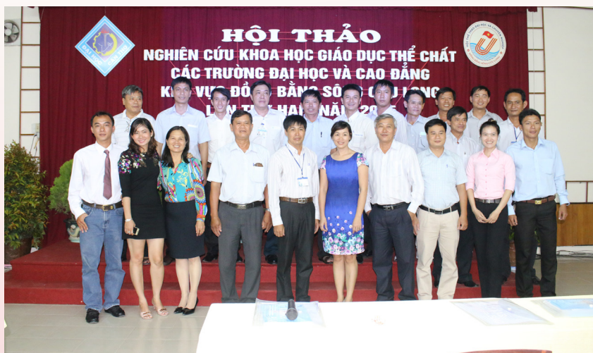
Đại biểu chụp ảnh lưu niệm.

Hội thảo đã thu hút nhiều bài viết với nội dung phong phú, xoay quanh các vấn đề như: thực trạng và giải pháp trong công tác đào tạo, công tác quản lý, công tác đánh giá, phương pháp trò chơi vận động, lợi ích của thể dục thể thao, nâng cao năng lực giảng viên,... Có 26 bài viết được đăng trong kỷ yếu, trong đó có 06 bài được chọn trình bày tham luận tại Hội thảo. Đặc biệt, năm nay, ngoài các bài viết từ các trường đại học: Cần Thơ, Đồng Tháp, Tiền Giang, Trà Vinh, Bạc Liêu, còn có sự đóng góp bài viết của trường Cao đẳng Sư phạm Nghệ An. Sau phần trình bày của các báo cáo viên, các đại biểu tham dự đã thảo luận sôi nổi và chia sẻ nhiệt tình góp phần làm nên thành công cho Hội thảo.