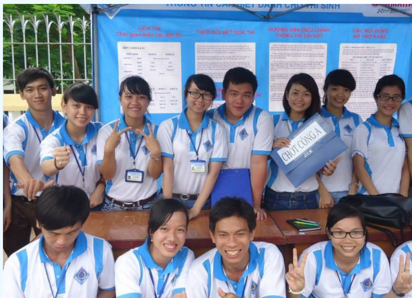
Những nụ cười rạng rỡ của sinh viên Trường ĐHTC trong hoạt động Tiếp sức mùa thi.

lo lắng, chuẩn bị hành trang cho kỳ thi tốt nghiệp, đại học cam go, thử thách. Mùa hè của sinh viên đại học là những chuyến đi xa, là mùa của những dấu chân tình nguyện.