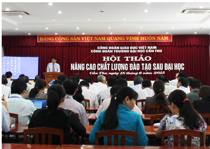
Toàn cảnh Hội thảo “Nâng cao chất lượng đào tạo sau đại học”.