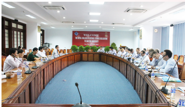
Buổi tiếp đón đoàn Tổng lãnh sự và Trường Nghiên cứu Quốc phòng Hoàng gia Vương quốc Anh.