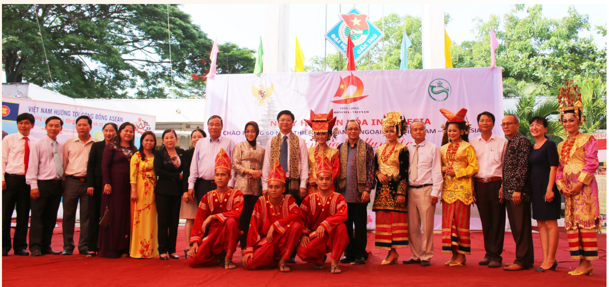
Đại biểu chụp ảnh lưu niệm.

nước hiểu và gần nhau hơn, cũng như hiểu hơn về thành viên trong cộng đồng ASEAN. Ông chia sẻ: "Việt Nam và Indonesia có một mối liên kết chặt chẽ. Chúng ta muốn nhìn thấy sự hợp tác chặt chẽ hơn, mạnh mẽ hơn bằng việc nâng tầm mối quan hệ lên thành "Đối tác chiến lược". Chúng ta không chỉ chúc mừng mà nên xem rằng đây là cột mốc quan trọng giúp cho sự hợp tác mang lại lợi ích cụ thể và gần gũi hơn trong tất cả các lĩnh vực trong những năm tới."