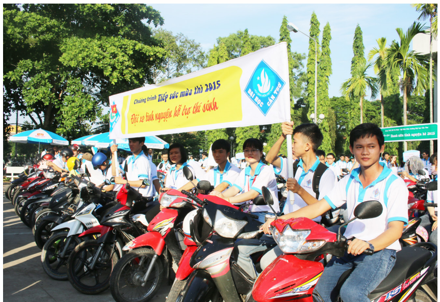
Đội xe tình nguyện hỗ trợ đưa rước thí sinh.

Tại buổi lễ, Phó Hiệu trưởng đã gửi lời cảm ơn đến các nhà tài trợ Công ty TNHH Xi măng Holcim; Công ty TNHH Xe máy Hồng Phúc-Thiên Phúc; Công ty Mobifone-Chi nhánh Cần Thơ; Công ty TNHH Thương mại Dịch vụ & Sản xuất Ngôi Sao Xanh đã đồng hành với Trường ĐHCT để hỗ trợ về kinh phí cũng như tư vấn về kỹ thuật để cho sinh viên Trường thực hiện tốt các hoạt động tình nguyện.