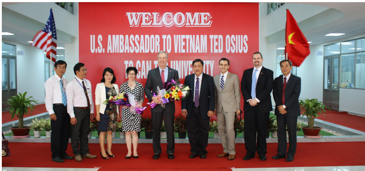
Tiếp đón ngài Ted Osius - Đại sứ Hoa Kỳ và đoàn công tác.