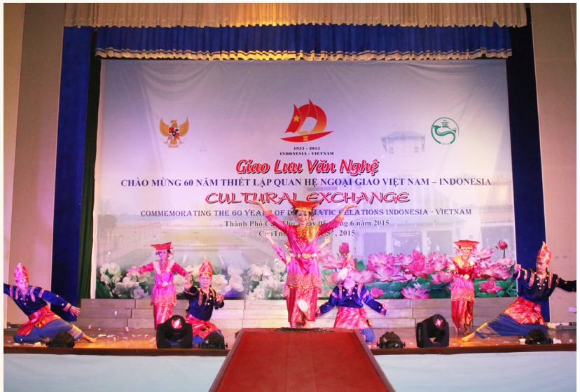
Tiết mục văn nghệ trong chương trình.