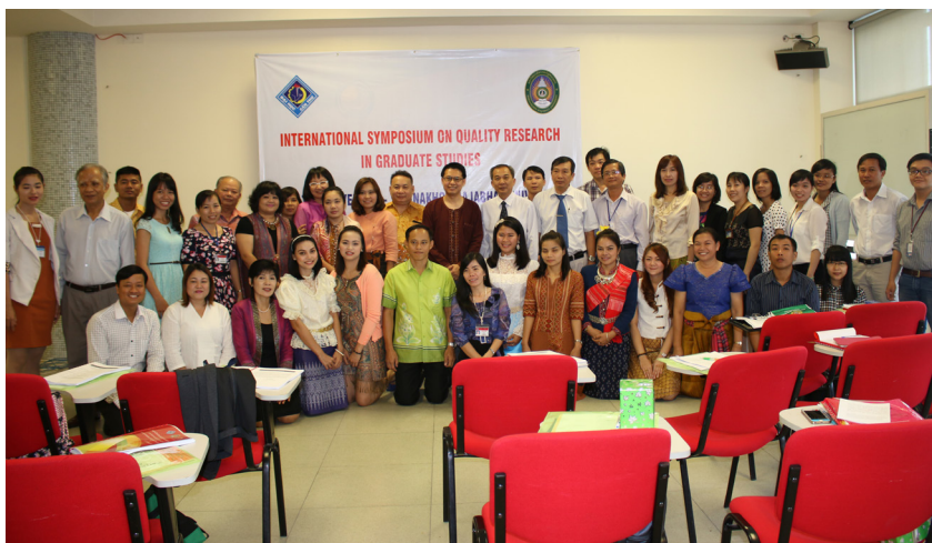
Ảnh lưu niệm.

Trong số các bài nghiên cứu gửi đến Hội thảo, có 20 bài viết được chọn báo cáo trong chương trình. Đề tài nghiên cứu chủ yếu xoay quanh các lĩnh vực như: ngôn ngữ, toán học, phương pháp giảng dạy và các vấn đề xã hội,... Tại Hội thảo, các giảng viên và học viên Cao học của hai trường đã nhiệt tình chia sẻ, thảo luận về quá trình nghiên cứu cũng như kết quả đạt được trong không khí vui vẻ, thoải mái.